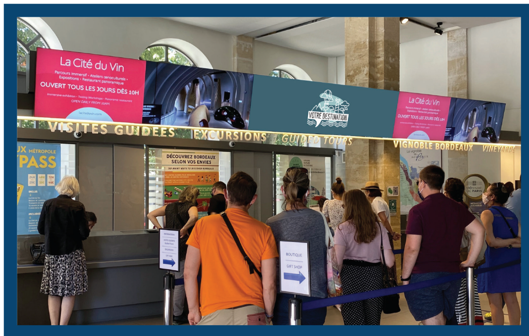
RÉSEAU OFFICE DE TOURISME BORDEAUX MÉTROPOLE