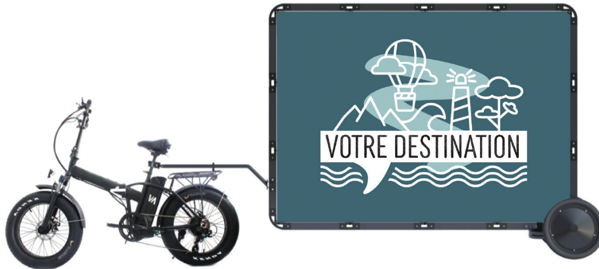
AFFICHAGE MOBILE 2M 2